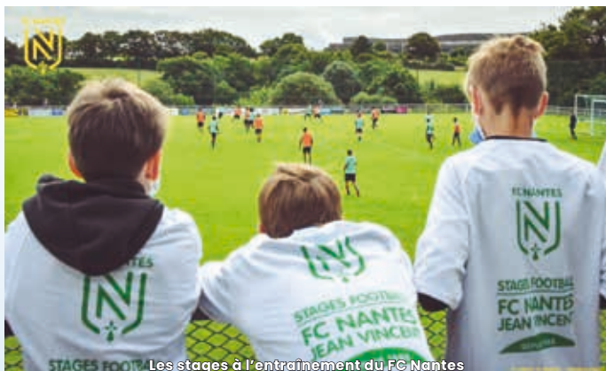
Les stages à l'entraînement du FC Nantes