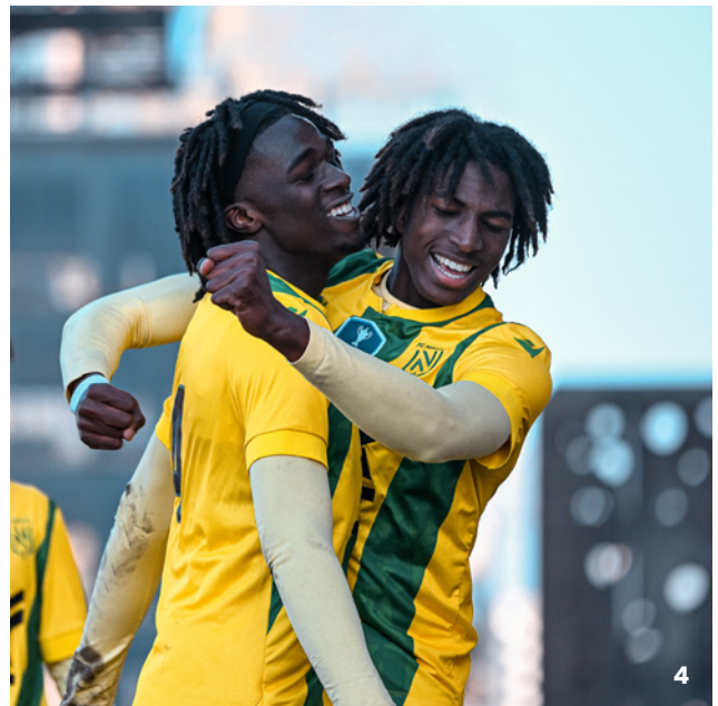
1. 64 ème de finale : Nort/Erdre AC – FC Nantes : 0-3 2. 32 ème de finale : Stade Poitevin – FC Nantes : 1-5 3. 16 ème de finale : Pontivy Stade – FC Nantes : 2-6 4. 8 ème de finale : FC Nantes – RC France : 2-0